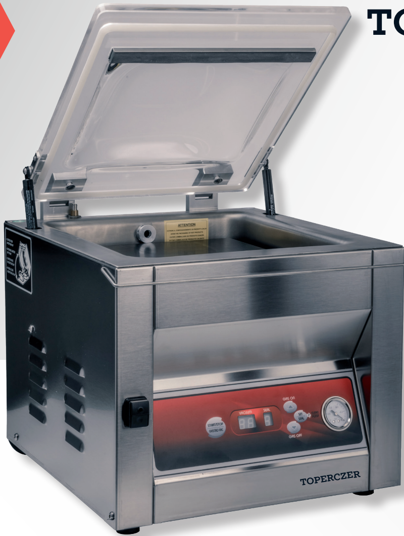
Modell TOP SYSTEM 30